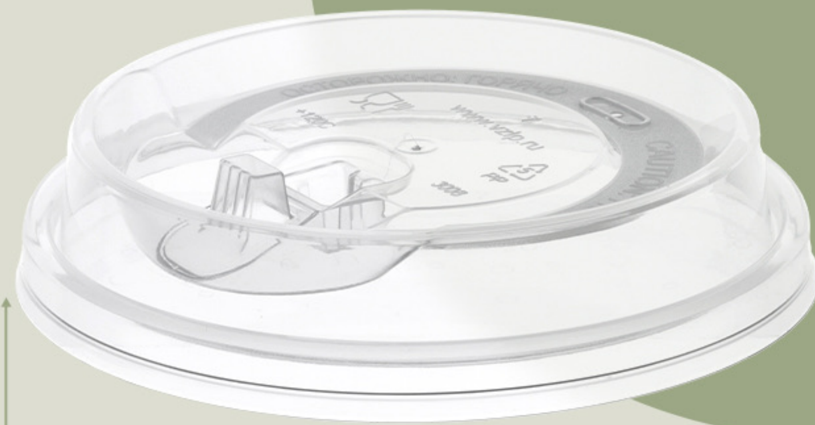
Для стаканов Ø 90 мм

Крышка изготовлена из высококачественного полипропилена