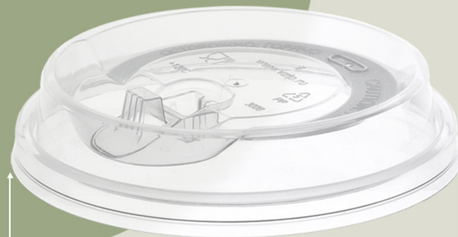
Для стаканов Ø 80 мм